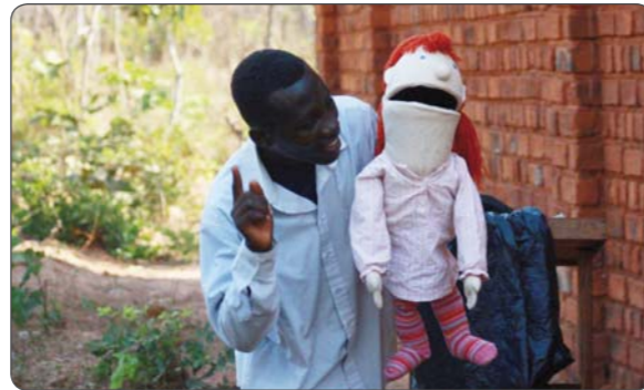
De bruger også hånddukker i børneklubben

At vi ledere på trods af modstand i Simbo må få visdom og frimodighed til at fortælle om Jesus. At jeg må få visdom til at oplære de unge ledere i Bibelen, så de kan formidle det videre på børneniveau.