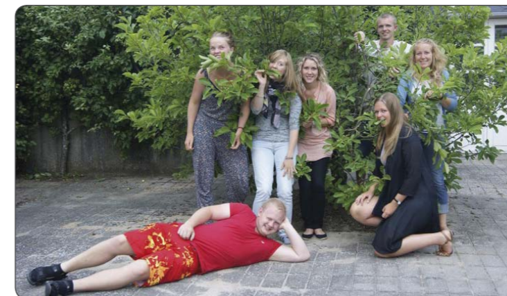
Afrika in touch, Mission Afrika og BDMs efterårsvolontører var på forberedelseskursus